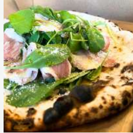
プロシュート・エルッコラ 生ハム&ルッコラ