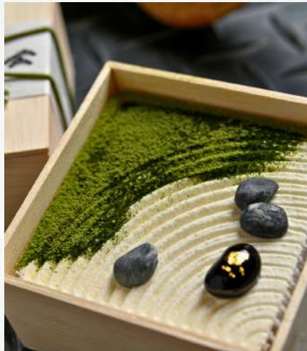
庭園ティラミスセット