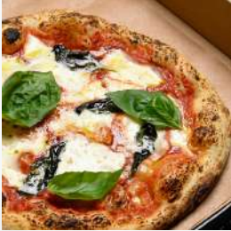
王道ピッツァ マルゲリータ