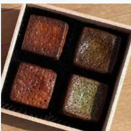
キュービックカヌレ プレーン・抹茶 2個ずつセット