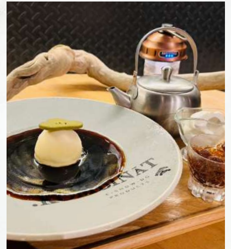
未完成コーヒーゼリーセット