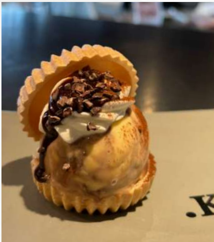
アイス最中セット