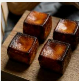
キュービックカヌレ (プレーン/抹茶)