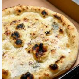
至高ピッツァ 4種のチーズ&蜂蜜