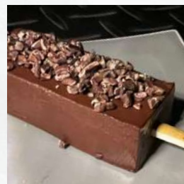
スイーツ串 各1本 400