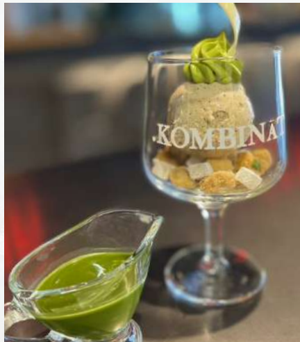
アフォガートセット